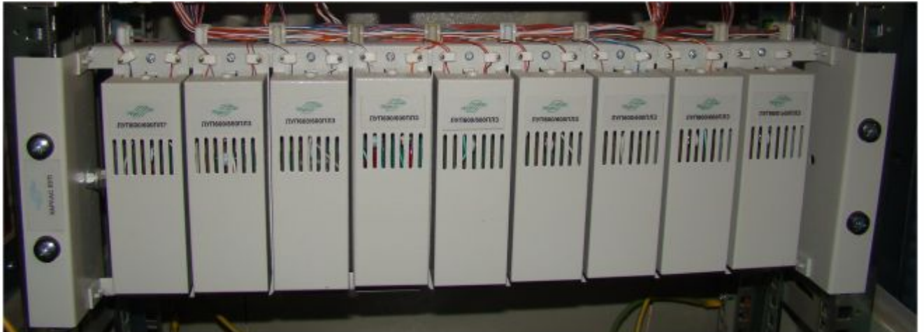
ЛУП 600/600 ПЛЗ на каркасі